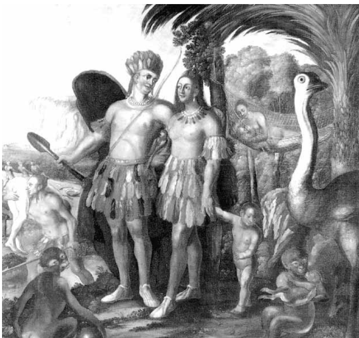
Charles Le Brun (Paris 1619-1690). "América".