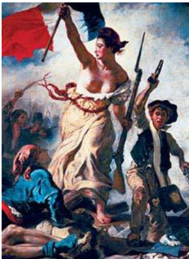
A Liberdade Conduzindo o Povo, de Delacroix: França exporta revolução