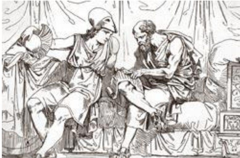
Ilustração do século 19: Sócrates como mestre do guerreiro Alcibíades.

O Nascimento das ideias, segundo o filósofo