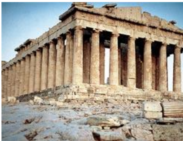
O Partenon de Atenas: marco do apogeu da cultura clássica grega.