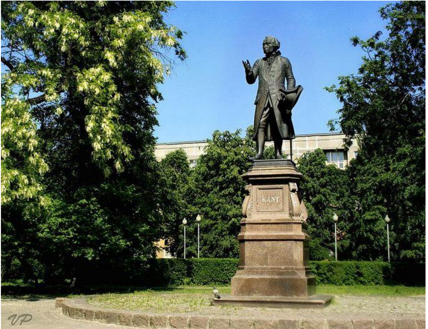
Estátua em homenagem a Kant em Königsberg

Já a sua licença para ensinar, que o torna vinculado à Universidade de Königsberg, somente será concedida após a apresentação de sua "Nova Explicação dos Primeiros Princípios do Conhecimento Metafísico".